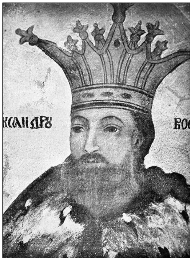
Nicolae Alexandru Voievod.

Despre doamna Klara mai știm că trăia ca văduvă, în 1370, la Curtea Domnească de la Argeș, sub protecția fiului ei vitreg, Vladislav-Vlaicu. Cu siguranță era în viață la momentul donației domnești pentru fratele ei (poate chiar aceasta a sugerat donația), Ladislaus, „ruda noastră iubită de sânge”, așa după cum se exprima Vlaicu Vodă. Dacă mai trăia la 1376/1377, nu știm cu certitudine. La fel de necunoscut rămâne și locul înmormântării sale. Să fi fost îngropată în necropola voievodală de la Câmpulung? Nu știm absolut nimic. Credem, mai degrabă, că doamna Klara a fost îngropată în necropola domnească de la Argeș.