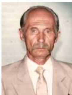
MEANDRE VOLUMUL II