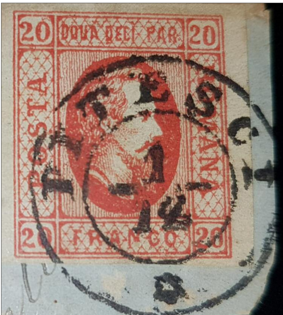
Marcă poștală cu efigia Domnitorului Alexandru Ioan Cuza. CUZA 20 par 1865. Ștampilă Pitești.