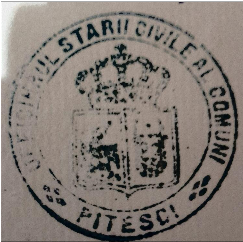
Ștampilă a Primăriei Comunei Pitești cu heraldica Principatelor Unite.