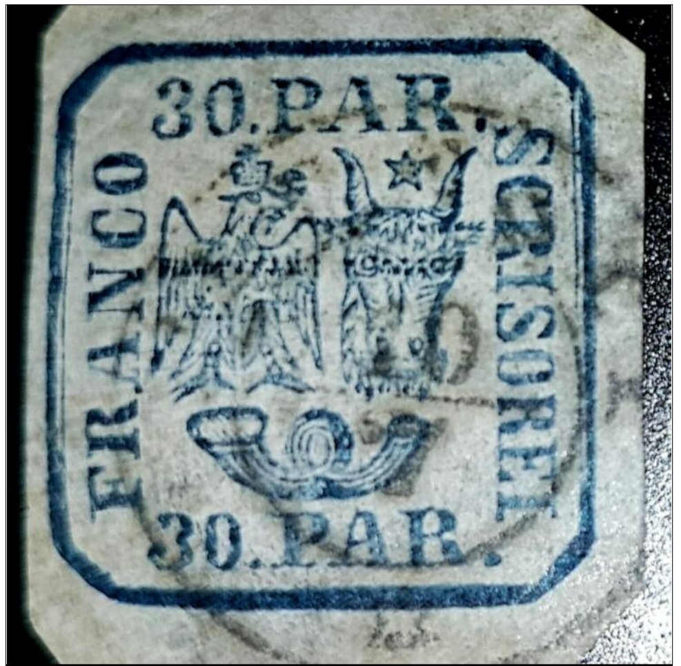
Prima marcă poștală circulantă pe teritoriul Principatelor Române. 30 par 1862. Ștampilă Pitești.