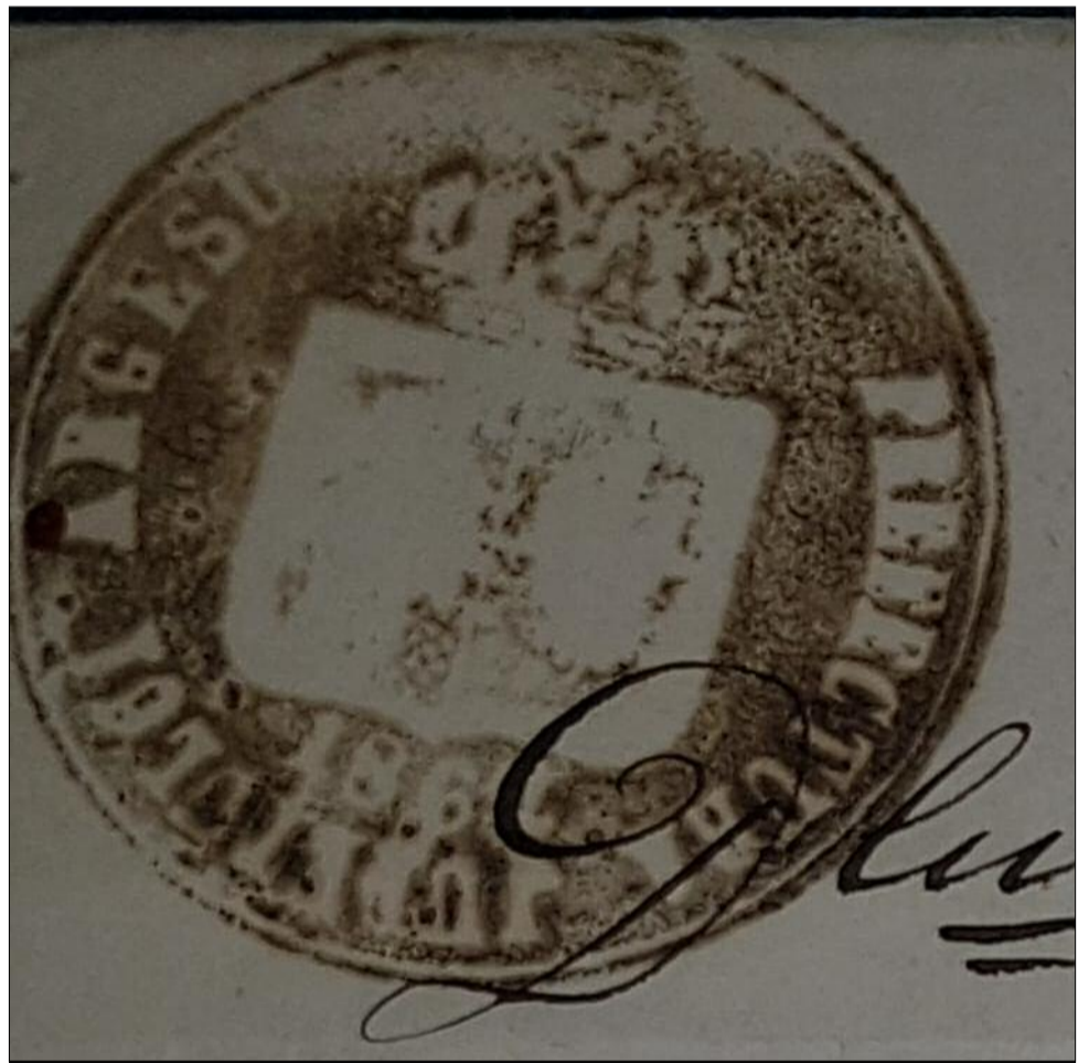
Sigiliul județului Argeș în perioada Principatelor Unite.