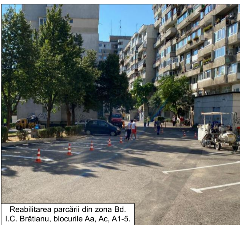
Reabilitarea parcării din zona Bd. I.C. Brătianu, blocurile Aa, Ac, A1-5.