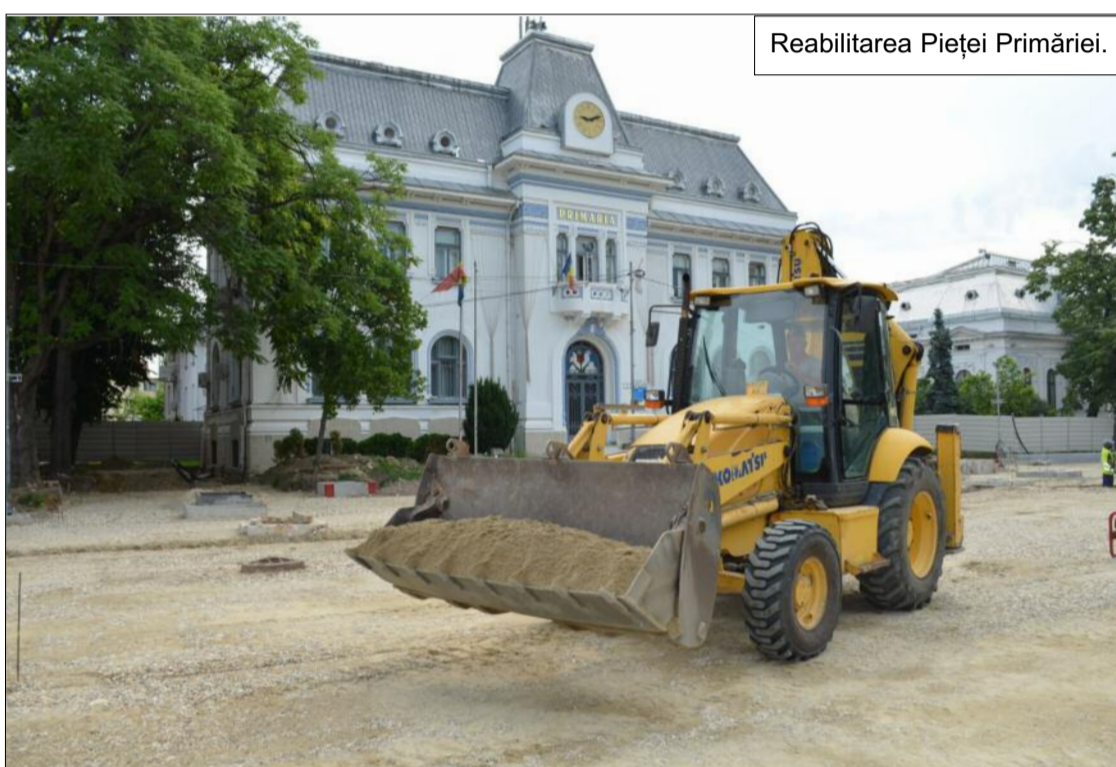
Reabilitarea Pieței Primăriei.