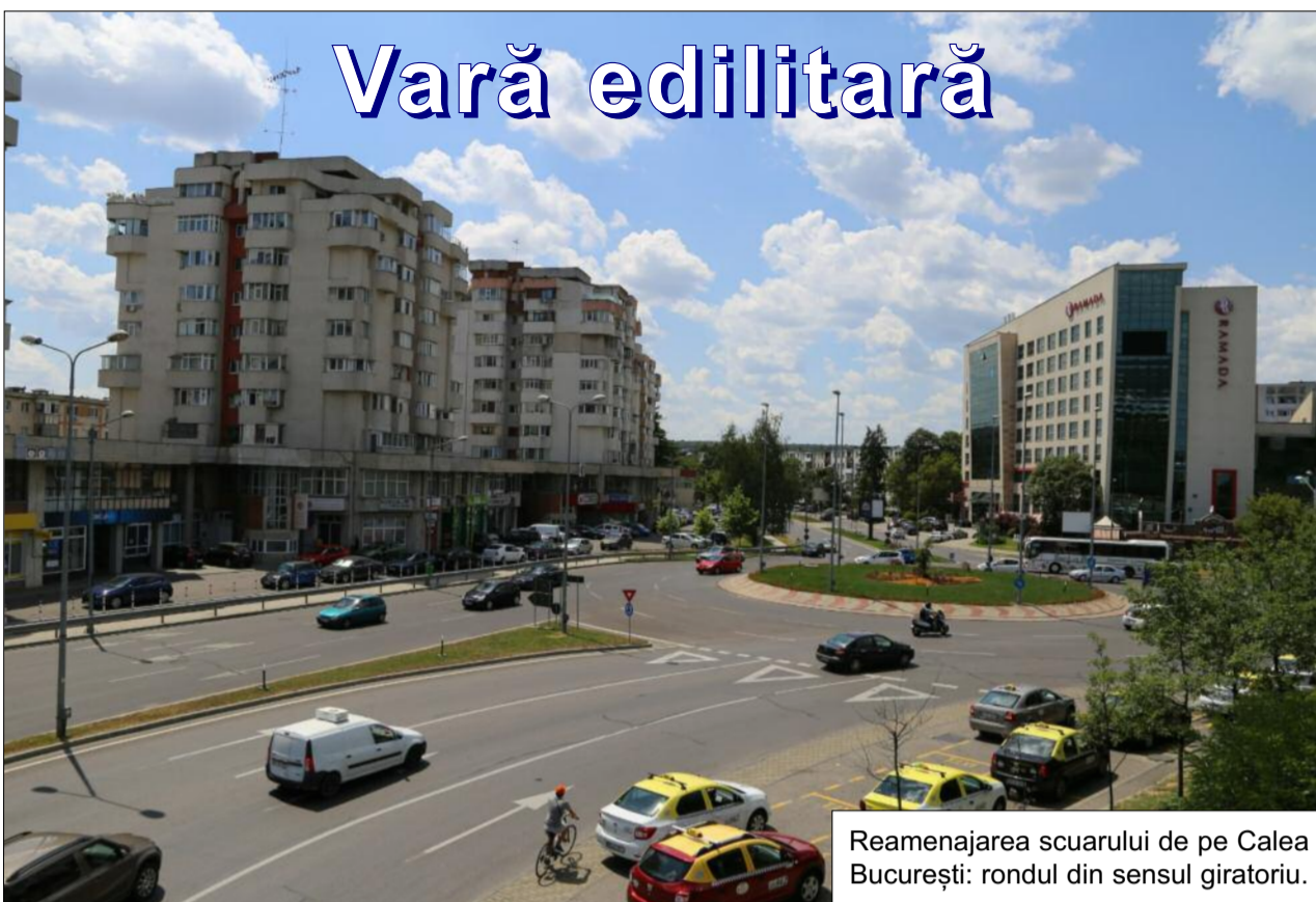
Reamenajarea scuarului de pe Calea București: rondul din sensul giratoriu.