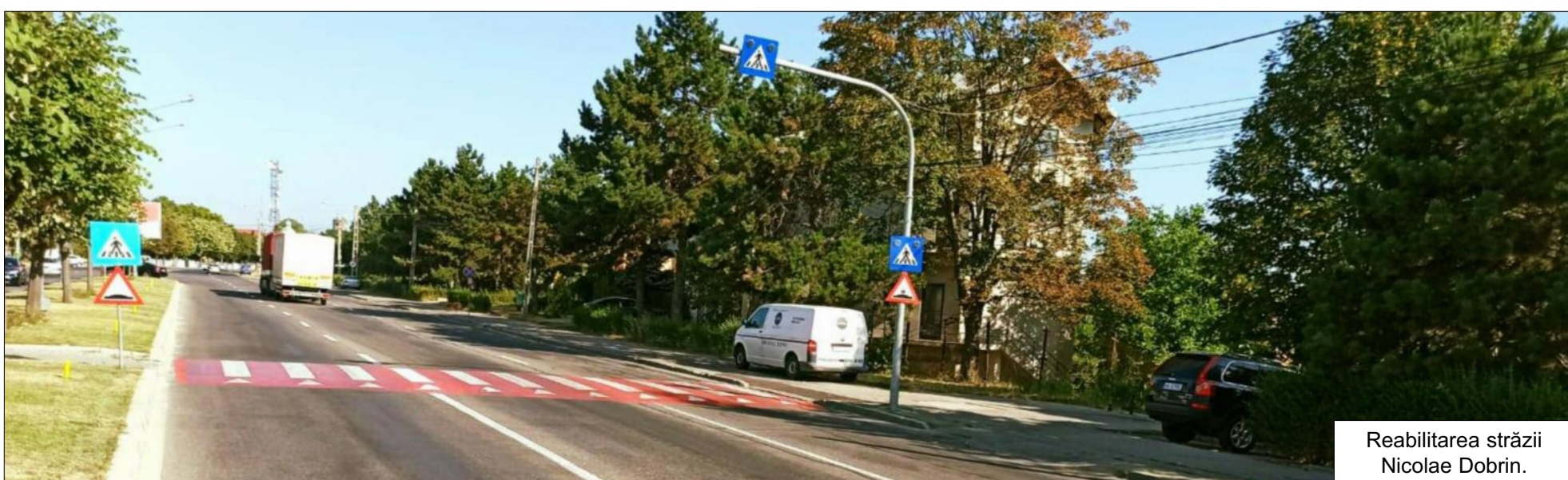
Reabilitarea străzii Nicolae Dobrin.