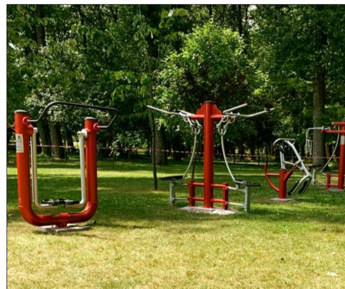
14 aparate de fitness noi în Parcul Lunca Argeșului.