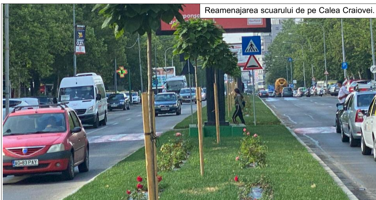
Reamenajarea scuarului de pe Calea Craiovei.