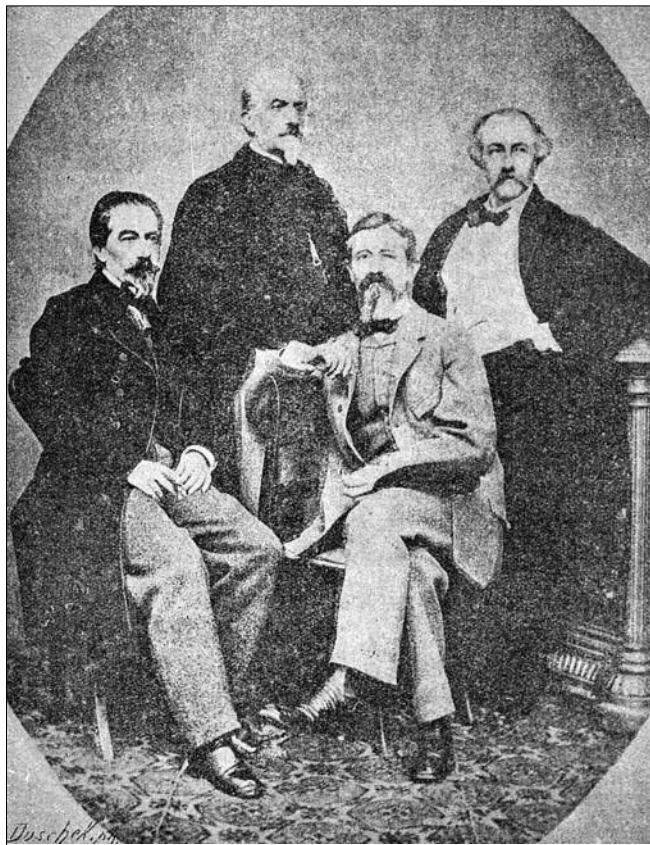
Frații Golești