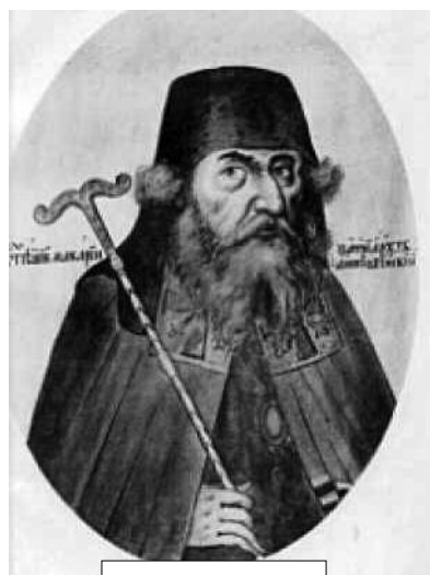
Paul de Alep

În dimineața zilei de 13 ianuarie 1657, Paul de Alep ajungea la Pitești, care, în opinia călătorului nostru, semăna mai degrabă cu un târg, decât cu un oraș în adevăratul sens al cuvântului. Dar, cu toate acestea, așezarea de la Pitești era vestită în toată Țara Românească, în vremea aceea, pentru vinul produs, care era „roșu și minunat de dulce” 6 . În seara aceleiași