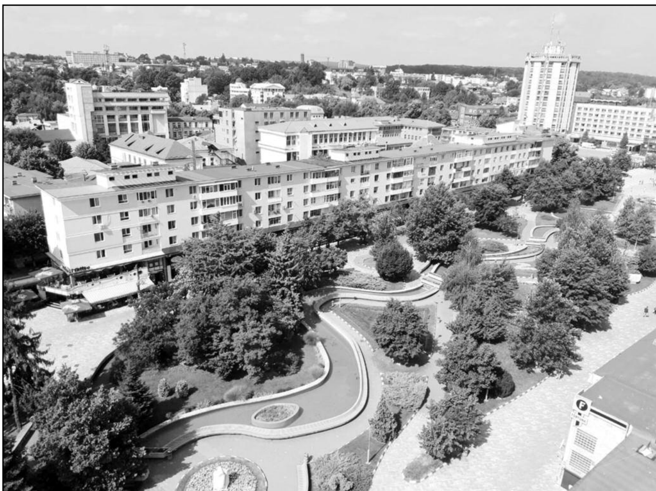
Pitești. Vedere din centrul orașului.

8 Cătălin Boboc, „Știutori de carte și slujitori ai scrisului în Țara Românească (secolele XIV-XVI)”, în Argesis. Studii și comunicări - Seria Istorie , tom. XV, Pitești, 2006, p. 270. A se vedea mai ales: Constantin Bălan, „Considerații privind activitatea «slujitorilor condeului» și semnificația prezenței lor în arealul Țării Românești în Evul de mijloc și la începutul Epocii Moderne”, în Revista Arhivelor , 1991, nr. 3, pp. 311-331.