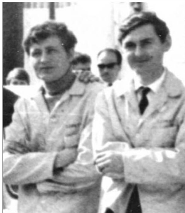
Ilioaea (în dr.) și Man. Un cuplu care nu a existat decât o vară.

Așa se ajunge la punctul culminant al evenimentelor nefaste pentru Victor, cursa organizată de reșițeni. Pe coasta de la Valea Domanului își aduce aminte de zilele sale de glorie și reușește, în sfârșit, să se impună. Fervoarea succesului nu va ține mult, pentru că vecinii de la Alfa ICSITA depun o contestație privind neconformitatea unor piese... precis indicate: volanta și carburatorul!? Altfel imposibil de detectat, dar contestatarii erau în cunoștință de cauză.