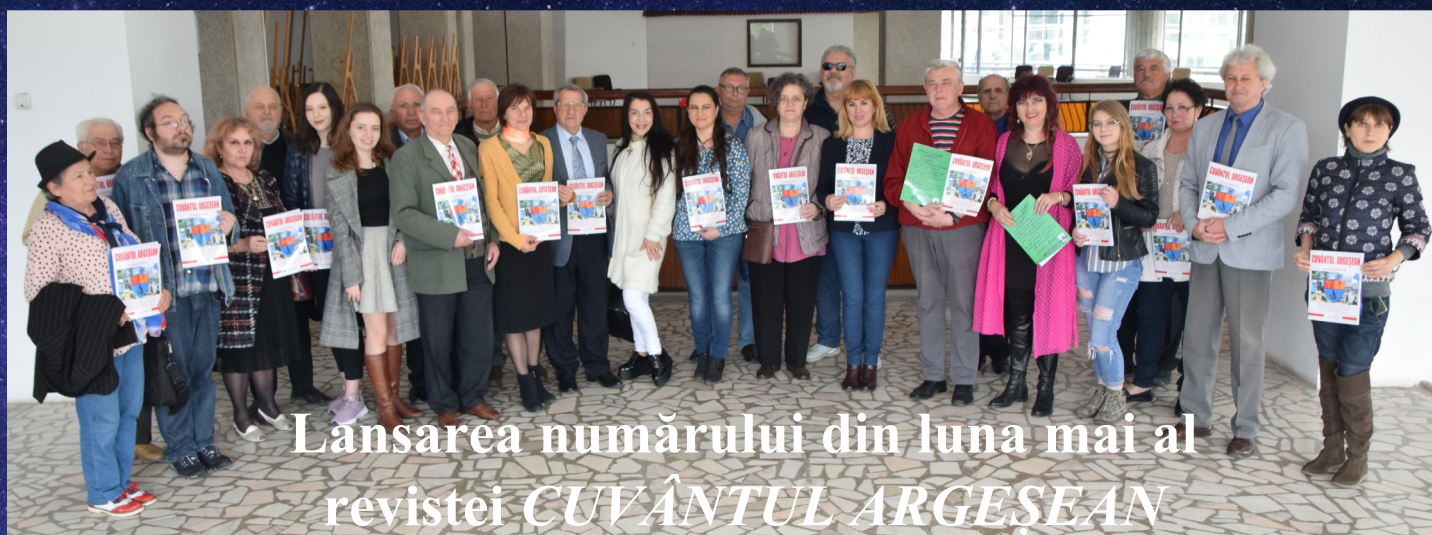
Lansarea numărului din luna mai al revistei CUVÂNTUL ARGESSEAN

IUNIE și al său cenaclu ARMONII ARGESSENE