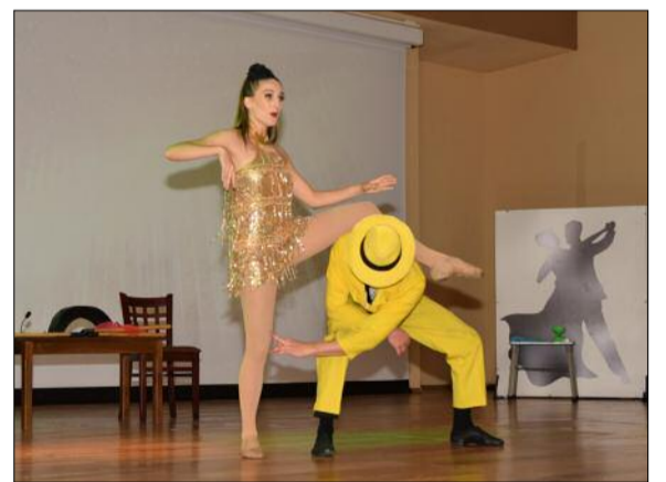
DAN&BIANCA. JAMES&REBECCA (Cameo Rascale, Australia) Organizatori: Primăria Municipiului Pitești, Centrul Cultural Pitești, Filarmonica Pitești, Clubul Total Dance