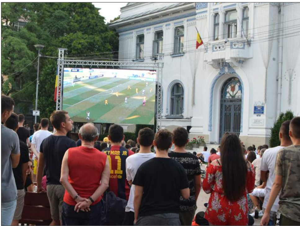
27 iunie 2019, Piața Primăriei Municipiului Pitești UEFA U-21: Germania U21 - România U21 (4-2)