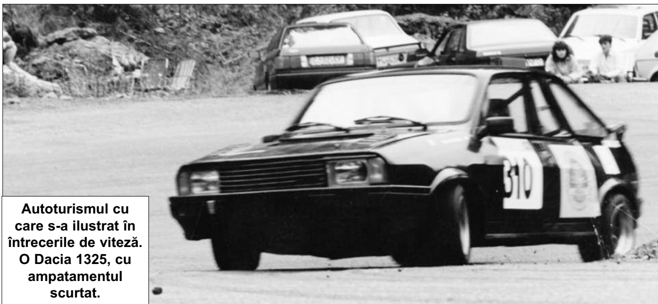
Autoturismul cu care s-a ilustrat în întrecerile de viteză. O Dacia 1325, cu ampatamentul scurtat.

Acesta a fost efectul plecării lui Necula. „Mișcarea“ s-a completat de minune cu alte evenimente ce s-au produs în interiorul compartimentului de competiții al uzinei, ce au condus la „ușurarea“ de câteva nume. Aici,