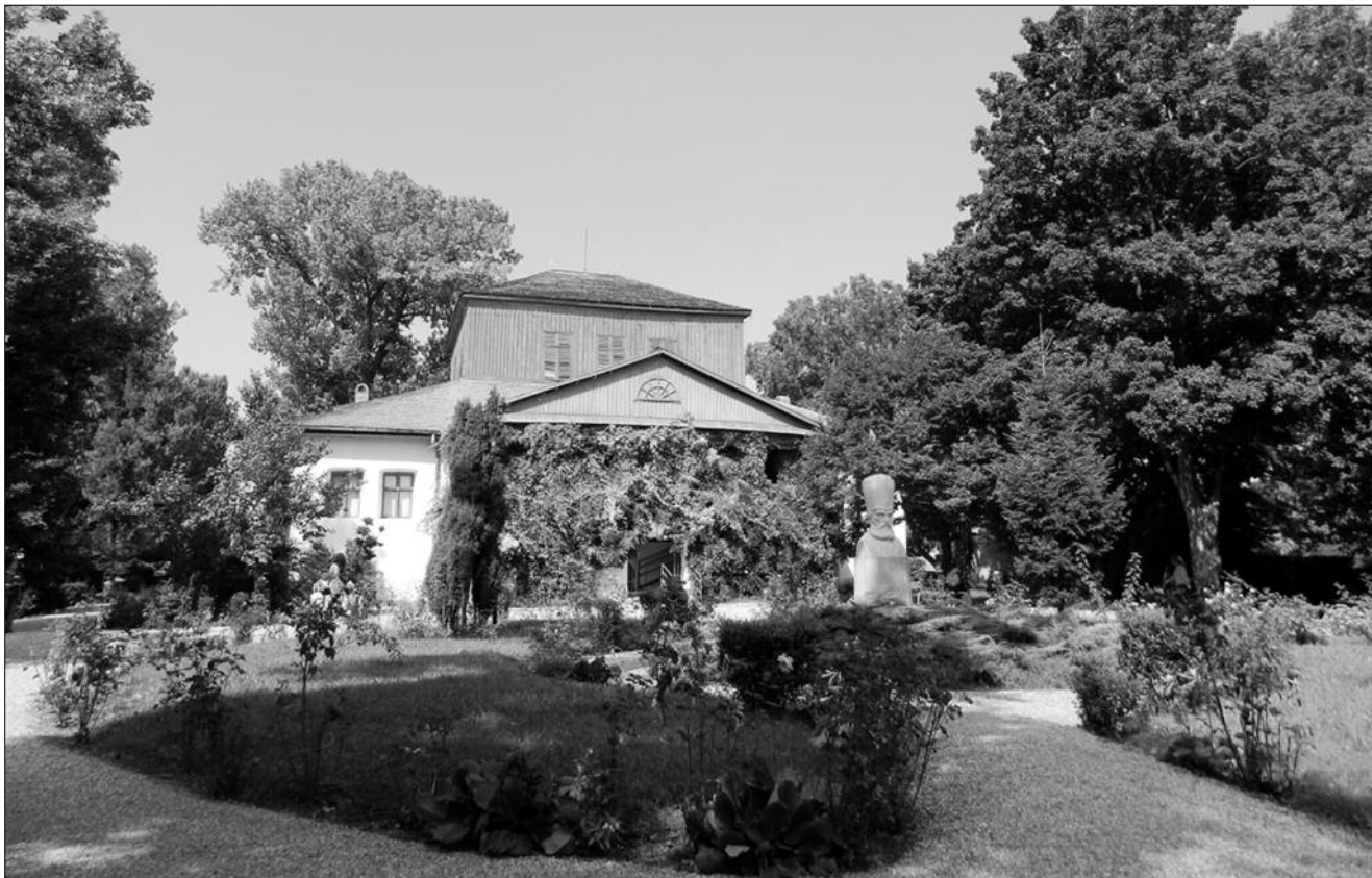
Curtea Conacului de Golești - Muzeul Viticulturii și Pomiculturii (secție înființată din 1966)

La 23 ianuarie 1716, mitropolitul Țării Românești, Antim Ivireanul, dădea carte de întărire egumenului mănăstirii de la Argeș, chir Ghenadie ieromonah, „ca să aibă a stăpâni doao vii care sunt în dealul Goleștilor, pe Topolog” 18 . Acestea fuseseră cumpărate de egumen de la Pârveu Suiceanu și de la Eupraxia, soția lui Ion Buicoiul, și de la popa Stan din Golești. În același an, la 7 aprilie, Nicolae Mavrocordat, primul domn fanariot al Țării