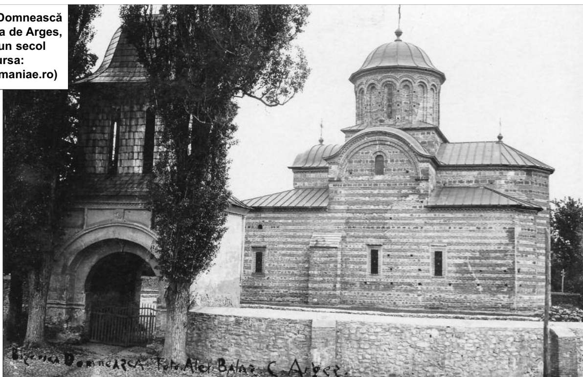
Biserica Domnească din Curtea de Argeș, acum un secol

După anul 1775 când nordul Moldovei (Bucovina) este cedat de Imperiul Otoman celui Austriac, Episcopia Rădăuților devina sufragară mitropoliei sârbești de la Carloviț, în timp ce temător de eventuale represalii, starețul Paisie și cei peste trei sute de ucenici sunt primiți la mănăstirea Secu, pentru ca mai apoi marelui duhovnic să i se ofere, spre păstorire, în 1779, Mănăstirea Neamț. Activitatea tipografică, culturală și duhovnicească extraordinară a lui Paisie și a obștii sale a produs o