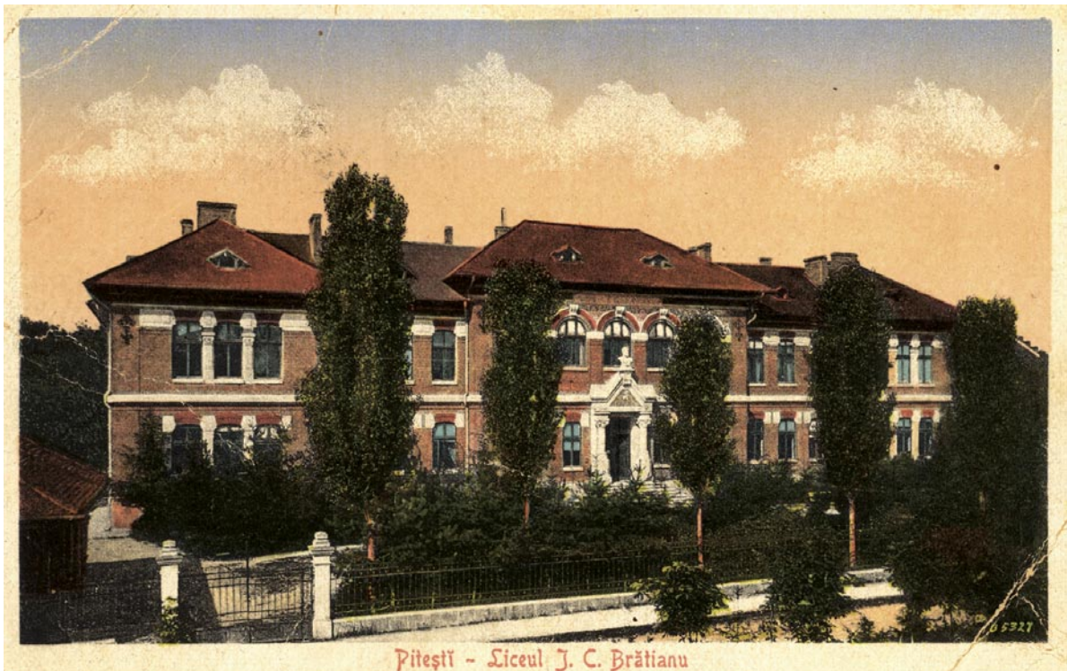
Pitești - Liceul J. C. Brătianu

Anul XXI ■ Nr. 3 (73)/2024 Serie nouă ■ 4 lei