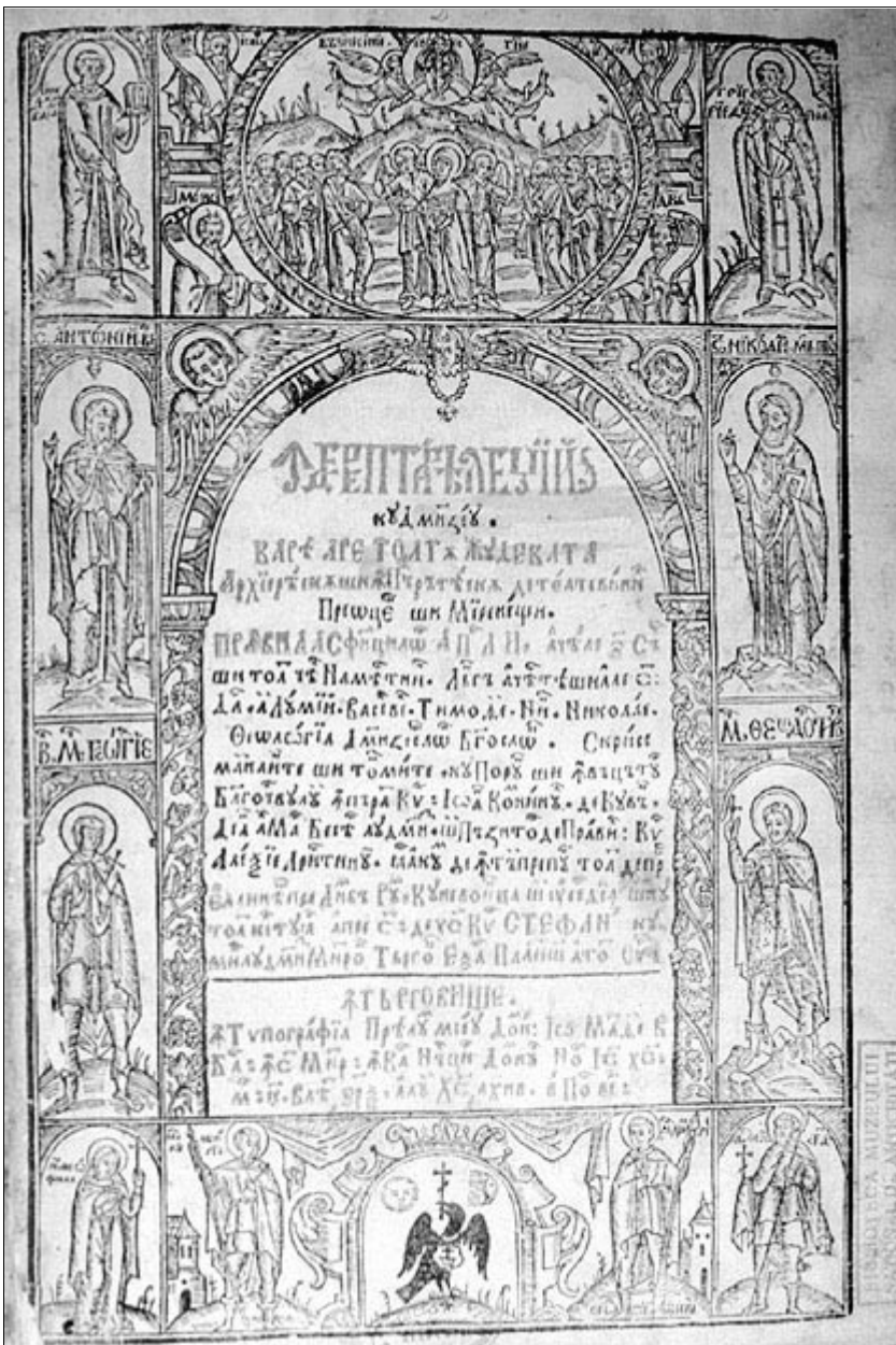
Îndreptarea legii, 1652, Biblioteca Academiei Române ( http://cimec.ro/carte/cartev/s17_0023.htm )

Constantin Noica, dorind să arate ce este etern și istoric în cultura noastră, alege trei momente culturale de culme reprezentate de tot atâtea personalități de excepție: primul este secolul al XVI-lea, marcat de opera culturală a Sfântului Voievod Neagoe Basarab; al doilea este al secolului al XVIII-lea, în care personalitatea exemplară a culturii române este Dimitrie Cantemir și al treilea, cel