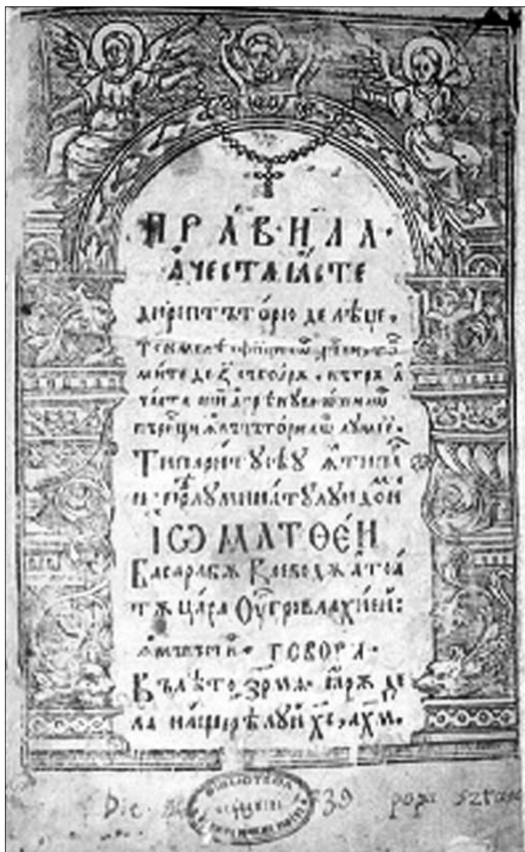
Pravila de la Govora, 1640, Biblioteca Academiei Române ( http://cimec.ro/carte/cartev/s17_0044.htm )

Spațiul nu ne permite să intrăm în amănunte însă noțiunea de drept românesc se regăsește în secolele XII-XIV, ca sistem cutumiar de norme juridice, la așezările valahe din Serbia, Croația sau Polonia. Realitățile și importanța acestui sistem juridic ce a caracterizat poporul român în perioada formării sale și a contribuit la menținerea ființei naționale a