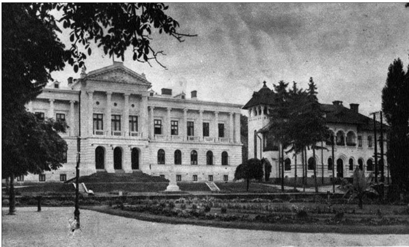
Palatul Administrativ (fostul)

Sper D-lor Consilieri că veți fi de acord cu mine spre a arăta recunoștința comunei acestor mari persoane.