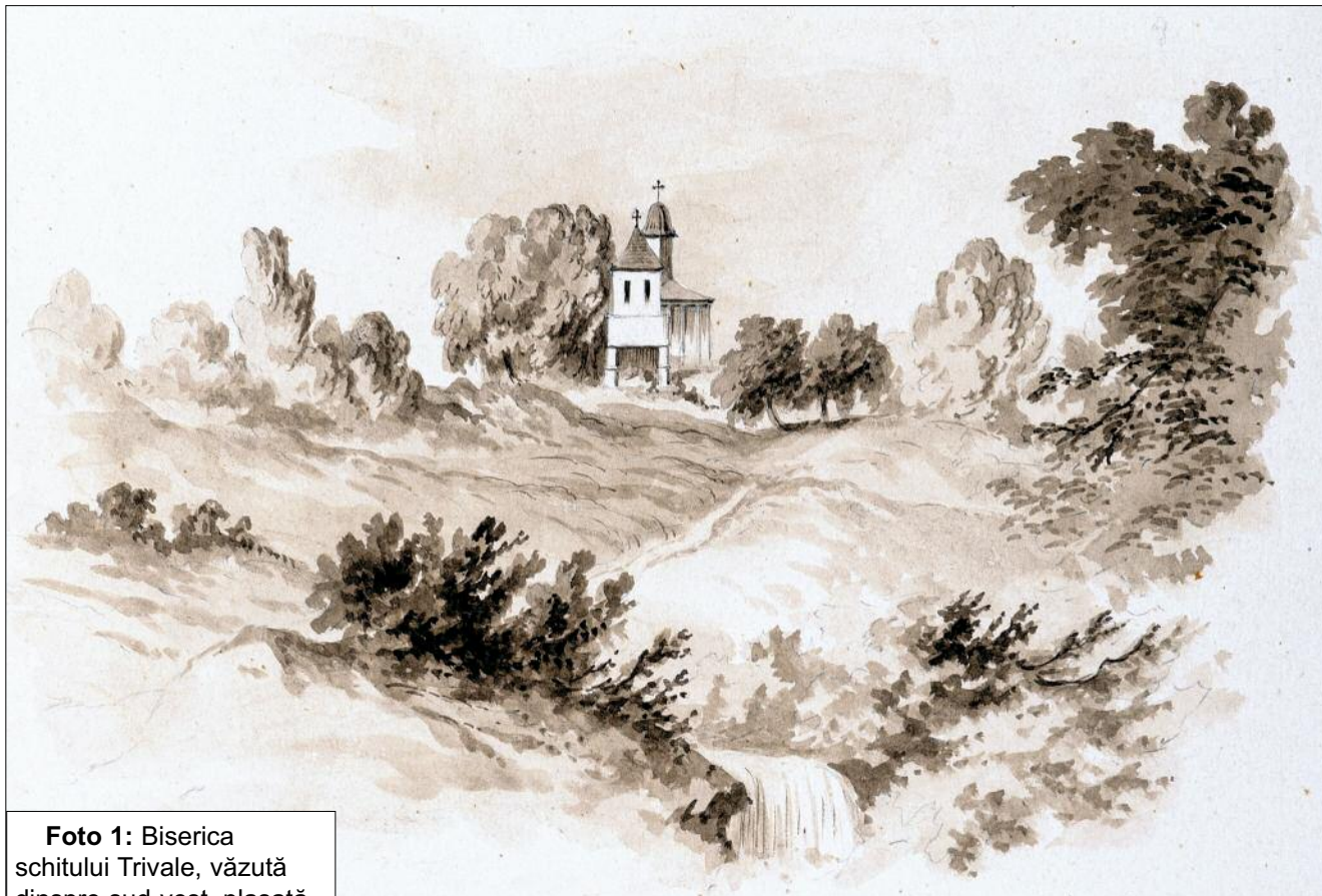
Foto 1: Biserica schitului Trivale, văzută dinspre sud-vest, plasată într-un peisaj conceput pictural, prin dozarea variată a intensității petelor de laviu. Desen de Henri Trenk, nedatat, circa 1860, cu legenda originală „Duoă metoașe ale Cozii: [...] 2. Trivallea, 1680, lângă Pitești”. Pictorul Henri Trenk l-a însoțit pe Alexandru Odobescu în călătoria de documentare istorică și arheologică a monumentelor din județele Argeș și Vâlcea din 1860.

Foto 2: Vedere. Pitești. Schitul Trivalea.