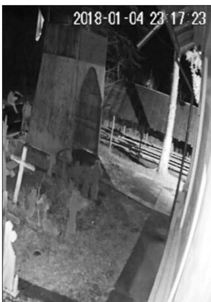
Vandalizarea și rezultatul ei

Într-o etapă ulterioară (în anul 1863), pe fațada sudică au fost adăugate reprezentări ale Morții, figurată o dată alături de arhanghelul Mihail disputându-și sufletul omului, și încă o dată, de dimensiuni mai mari, cu coasă și mantie. Chipul