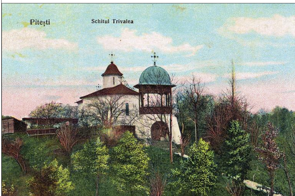
Foto 2: Vedere. Pitești. Schitul Trivalea.

Foto 1: Biserica schitului Trivale, văzută dinspre sud-vest, plasată într-un peisaj conceput pictural, prin dozarea variată a intensității petelor de laviu. Desen de Henri Trenk, nedatat, circa 1860, cu legenda originală „Duoă metoașe ale Cozii: [...] 2. Trivallea, 1680, lângă Pitești”. Pictorul Henri Trenk l-a însoțit pe Alexandru Odobescu în călătoria de documentare istorică și arheologică a monumentelor din județele Argeș și Vâlcea din 1860.