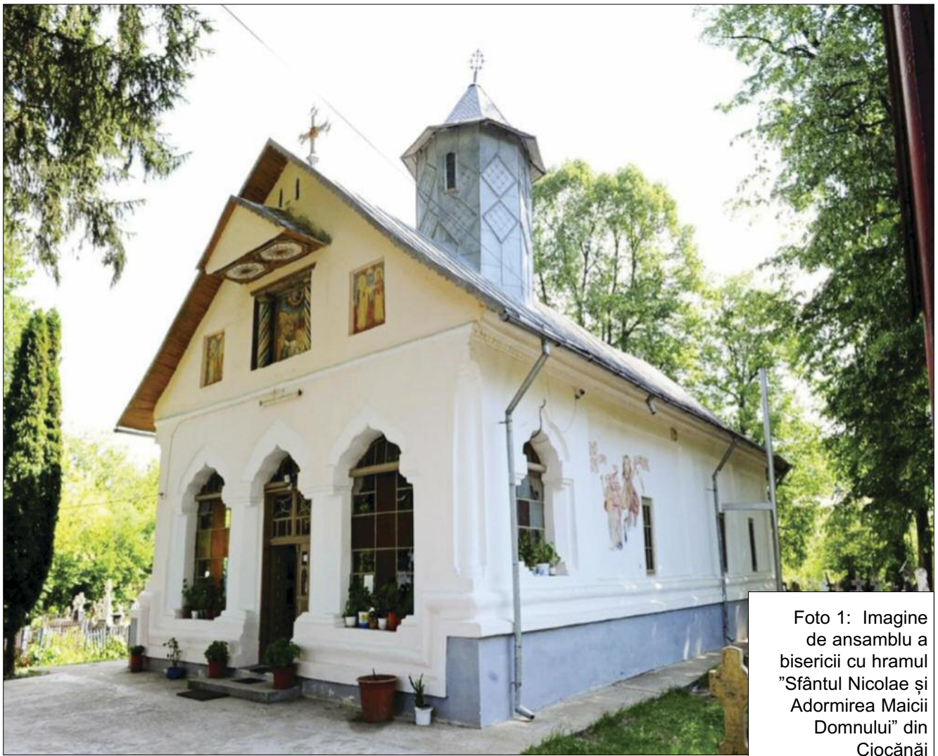
Foto 1: Imagine de ansamblu a bisericii cu hramul "Sfântul Nicolae și Adormirea Maicii Domnului" din Ciocănai