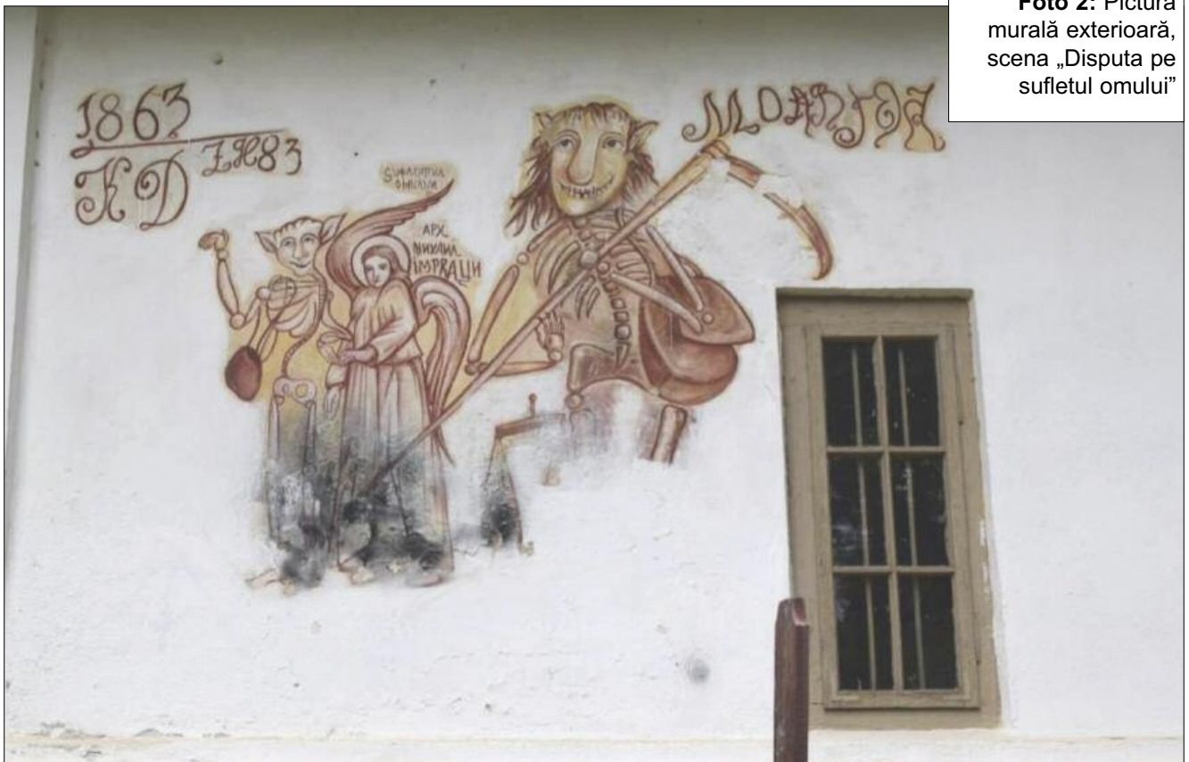
Foto 2: Pictura murală exterioară, scena „Disputa pe sufletul omului”