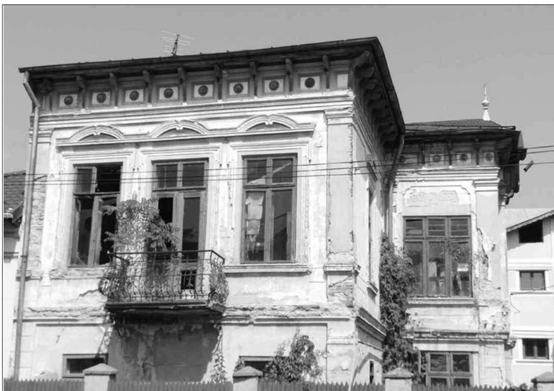
Casa Căpitanlov, monument istoric (1913,1916)

Epoca modernă britanică pusă sub semnul marelui imperiu maritim colonial este guvernată cu siguranță și de consumul de ceai. Imperiul deasupra căruia soarele nu apunea niciodată și care încet, încet pune bazele revoluției industriale este cucerit de către ceai datorită beneficiilor sale asupra sănătății și vitalității. Emblemă a Britaniei și a civilizației sale din ultimele două secole, consumul