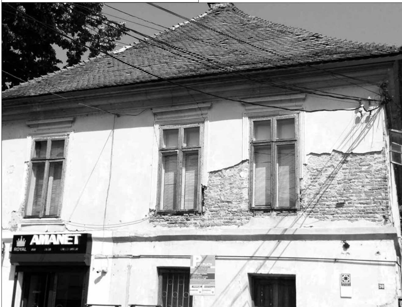
Casa Saitescu, monument istoric (sec. XIX)

De asemenea, Botezul ocupa un loc prioritar în viața comunității creștine din primele secole. Botezul se oficia prin scufundare, deși stropirea cu apă sau turnarea apei erau și ele forme acceptate. La început, bisericile îi acceptă la botez numai pe cei credincioși. Tertullian trăgea un semnal de alarmă împotriva botezului copiilor: „Copii să vină la botez