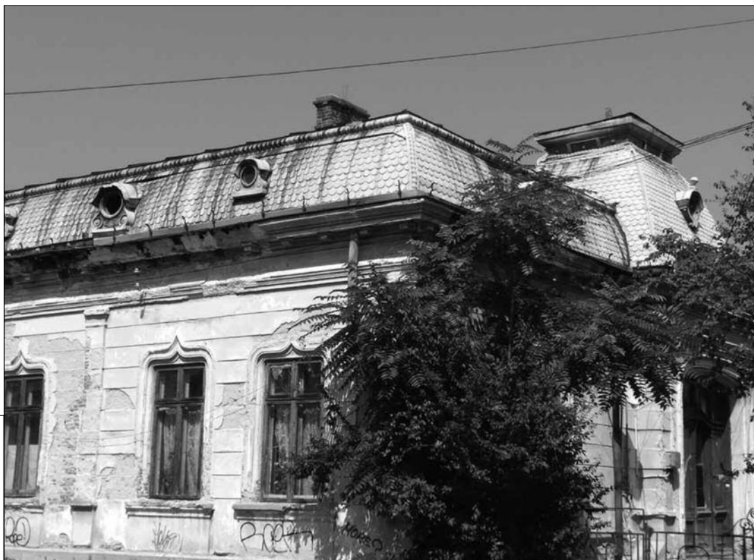
Casa Gheorghe Nițulescu, monument istoric (1911-1914)

La fel de numeroase sunt însă și exemplele alimentelor ne-europene care nu au fost adoptate de bucătăria occidentală. Ușurința acceptării unora dintre deliciale de mai sus s-a datorat contemporaneității lor cu teoretizarea sistemului umoral. Mai precis, aceste produse au ajuns pe piața europeană mai întâi ca medicamente și abia mai târziu ca hrană. Un caz tipic pentru cele enunțate mai sus este reprezentat de utilizarea zahărului. Succesul său în Europa, începând din secolul al XVII-lea, a produs o adevărată revoluție culinară. Majoritatea rețetelor medievale conțineau atât ingrediente picante, cât și dulci, lăsând de cele mai multe ori compoziția finală la alegerea