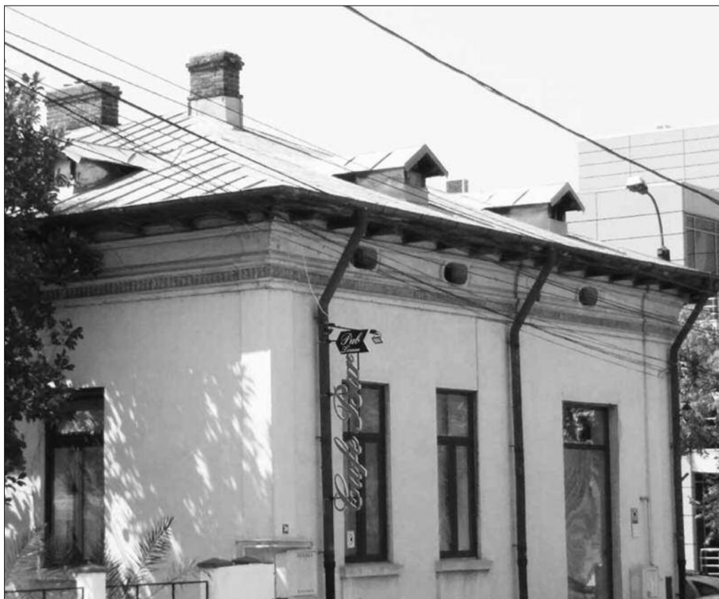
Casa cu prăvălie Nicolae Ciuculescu, monument istoric (1921)

Idem, A History of World in 6 Glasses , U.S.A.-Bloomsbury, 2006