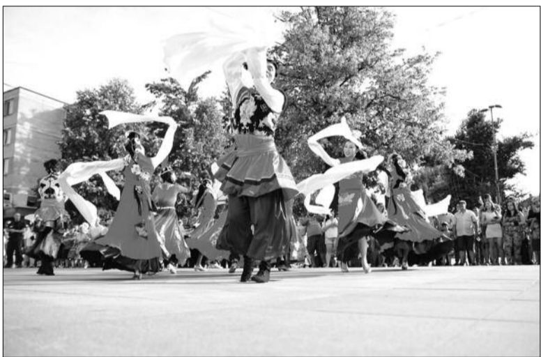
Festivalul Internațional de Folclor „Carpați”