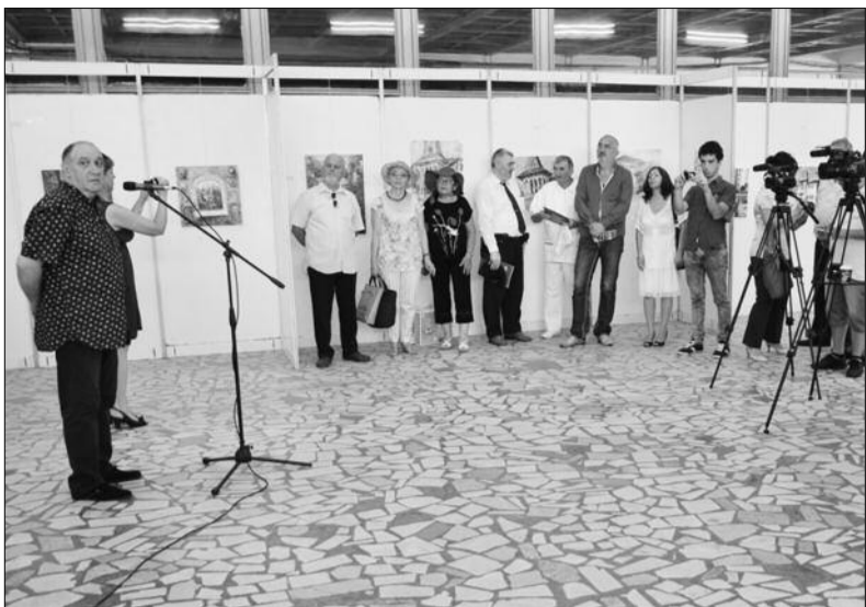
Tabăra Națională de Creație Plastică „Ion Gheorghe Vrăneanțu”