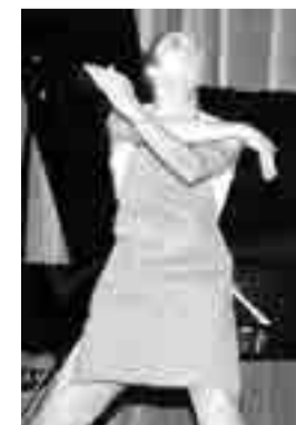
Pagină coordonată de Mihaela FULGEANU MATEI

Un german și o româncă la Pitești. O orchestră și un dirijor de talent. Un gerar plin de căldură și de muzică. Toate la Filarmonica Pitești!