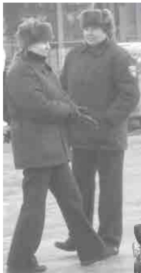
Pagini realizate de Mihaela FULGEANU MATEI

•Agenții Poliției Locale Pitești au identificat, în decembrie-ianuarie a. c., 407 de autovehicule parcate neregulamentar (trotuare, spații verzi), dintre care au fost ridicate 73. Toți proprietarii au fost sancționați. Au fost aplicate 22 de sancțiuni contravenționale vehiculelor cu tracțiune animală și 45 pentru nerespectarea ordinii și liniștii publice. Au fost verificați 204 de agenți economici și producători agricoli și 15 de unități de alimentație publică. Au fost efectuate 24 de controale în vederea menținerii disciplinei în construcții. Au fost date 31 de sancțiuni pentru expunerea spre vânzare a unor produse agroalimentare în locuri publice nepermise potrivit legislației în vigoare. S-au efectuat acțiuni pentru siguranța călătorilor în mijloacele de transport în comun. Polițiștii locali au asigurat desfășurarea în condiții optime a activității celor șase centre de colectare taxe și impozite.