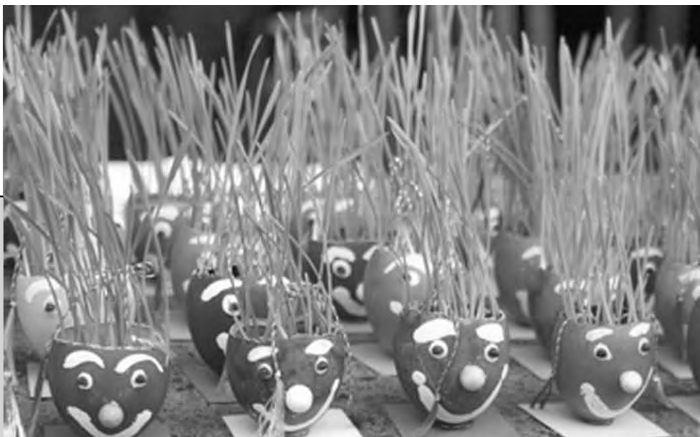
64.000 de lei - profitul Primăriei de pe urma tradiționalului Târg al Mărțișorului

În perioada 22 februarie-10 martie a. c., s-a desfășurat, în zona centrală a orașului, tradiționalul „Târg al Mărțișorului”, la care au participat 340 de expozanți, persoane fizice și juridice, care au vândut produse specifice primăverii: mărțișoare, flori și aranjamente florale. Pentru spațiul acordat municipalitatea a încasat suma de 64 000 de lei, reprezentând venit la bugetul local al Piteștiului.