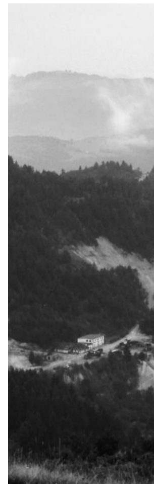
Număr ilustrat cu fotografii de la Roșia Montană - FânFest 2007. (Simona Fusaru)

O revistă are, în mod logic, un program estetic propriu. În schimb tendința scriitorilor actuali – incitați de tehnica ultramodernă – este să trimită același text la cât mai multe publicații. Ceea ce nivelează peisajul revuistic până la omogenizarea totală. De aceea, îi anunțăm pe