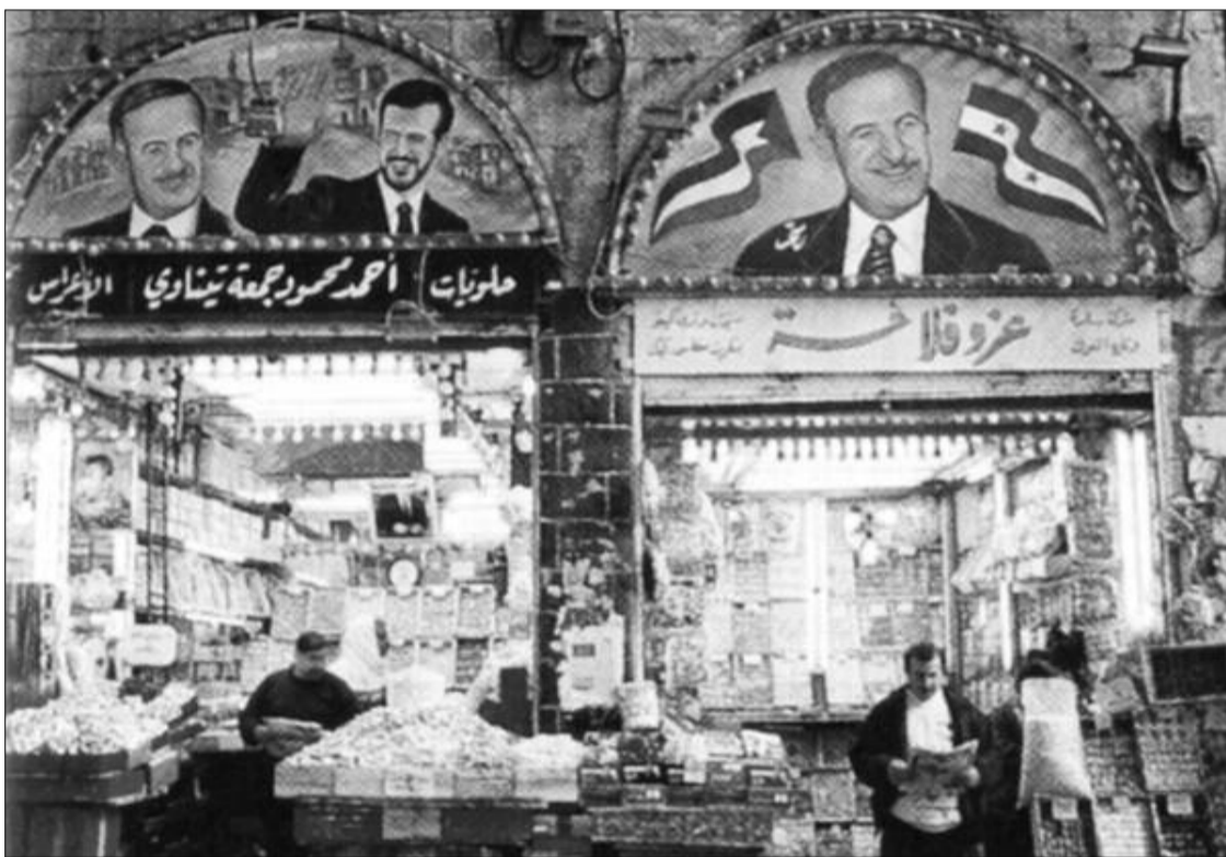
Propagandă pro Assad, tată și fiu, pe fațada unui magazin din Damasc