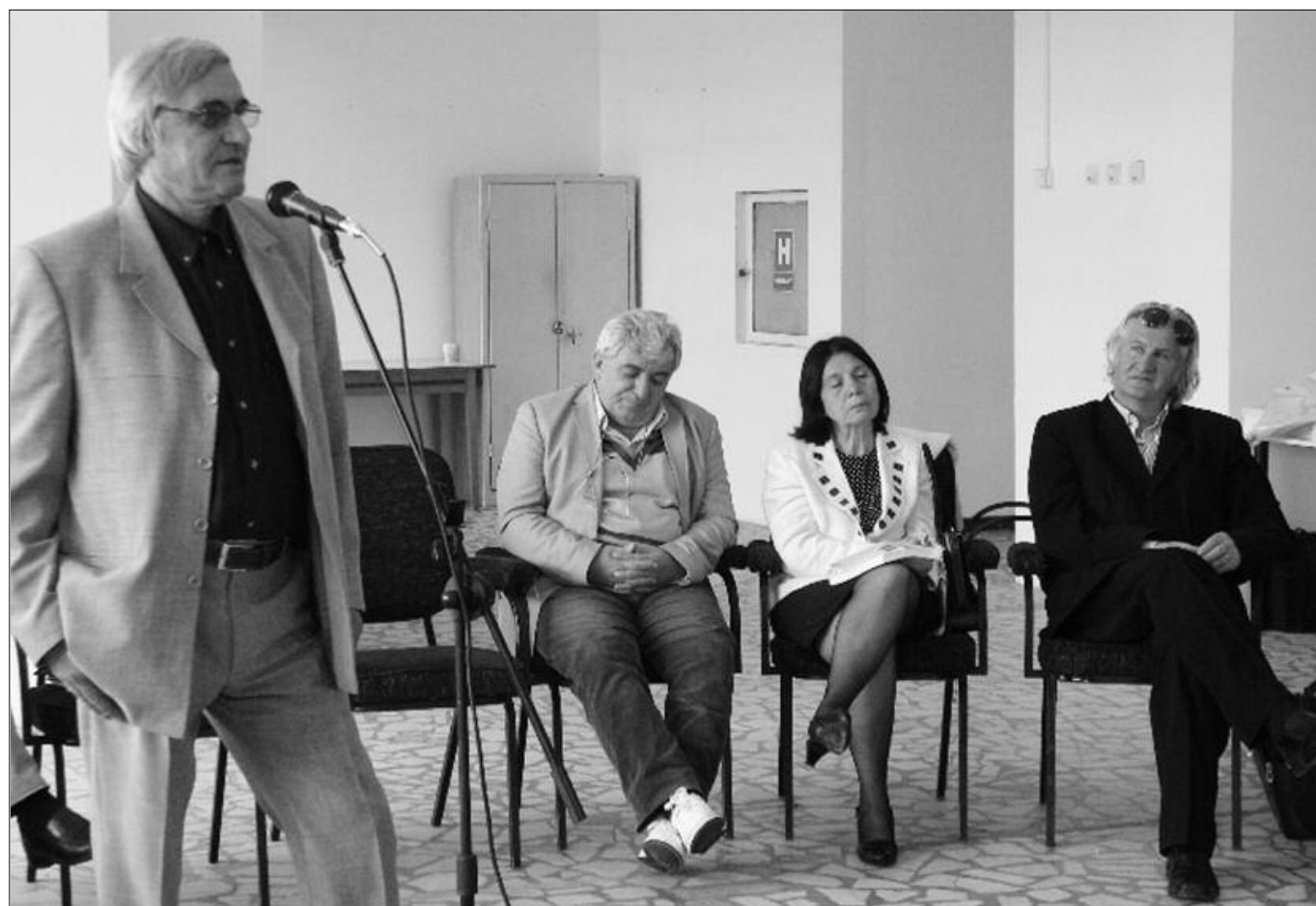
Supliment îngrijit de Dumitru Augustin Doman și Simona Fusaru și ilustrat cu fotografiile din arhiva revistei și din colecțiile Jean Dumitrașcu, Vasile Ghițescu, Dan Rotaru.